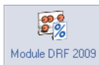
Module DRF 2009